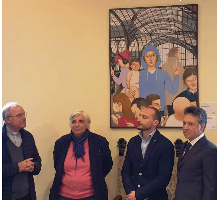
Un momento della cerimonia di donazione dell'opera